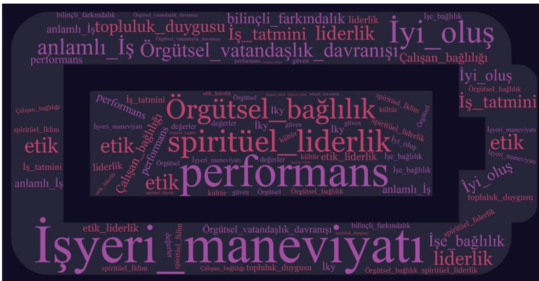
Şekil 1. Araştırmada Ulaşılan Anahtar Kelimelere İlişkin Kelime Bulutu

VOSviewer üzerinden gerçekleştirilen bibliyometrik analiz sonucu oluşan ağda 20 öge (düğüm 1 /anahtar kelime) yer almıştır. Bir külliyyatta en çok ve en az kullanılan kavramın/kelimenin kullanım değerlerinden yola çıkarak yazım boyutunun ayarlanması ile ortaya çıkan ve kelimelerin kullanım sıklığını daha iyi anlamak için kullanılan kelime bulutu, ulaşılan 20 ögenin kullanım sıklığına ilişkin ön bir izlenim sağlamak amacıyla Şekil 1’de sunulmuştur.